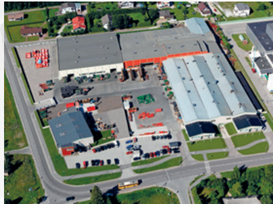
La fábrica de Fors MW está diseñada para la producción de series cortas. Se encuentra en Saue, a 15 km de Tallin (Estonia). La zona de producción abarca 40 000 m 2 (de ellos, 18 000 m 2 están techados).

Es posible encontrar clientes nuestros en cualquier parte, desde pequeñas a grandes empresas y en los sectores más variados. Sus actividades son de distinta naturaleza y se llevan a cabo en condiciones diferentes. Sin embargo, siempre tienen algo en común: la necesidad de disponer de productos fiables para mantener el negocio en